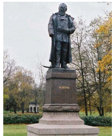
Q3 Carl-Heine-Denkmal in Leipzig

M10: Denkmal https://t1p.de/heinedenkmal