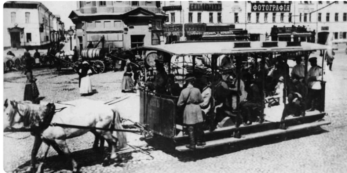
Q5: Moskau Pferdebahn, Bild: Bundesarchiv, Wikimedia, gemeinfrei, https://t1p.de/shh2

Mit der Straßenbahn durch Leipzig zu fahren, ist heute ganz normal. Doch das war nicht immer so. Am 18. Mai 1872 begann mit der Eröffnung des Linienbetriebs der Leipziger Pferde-Eisenbahn die Geschichte der Straßenbahn in Leipzig. Die Abbildung Q5 zeigt dir, wie die Pferdestraßenbahn ausgesehen hat.