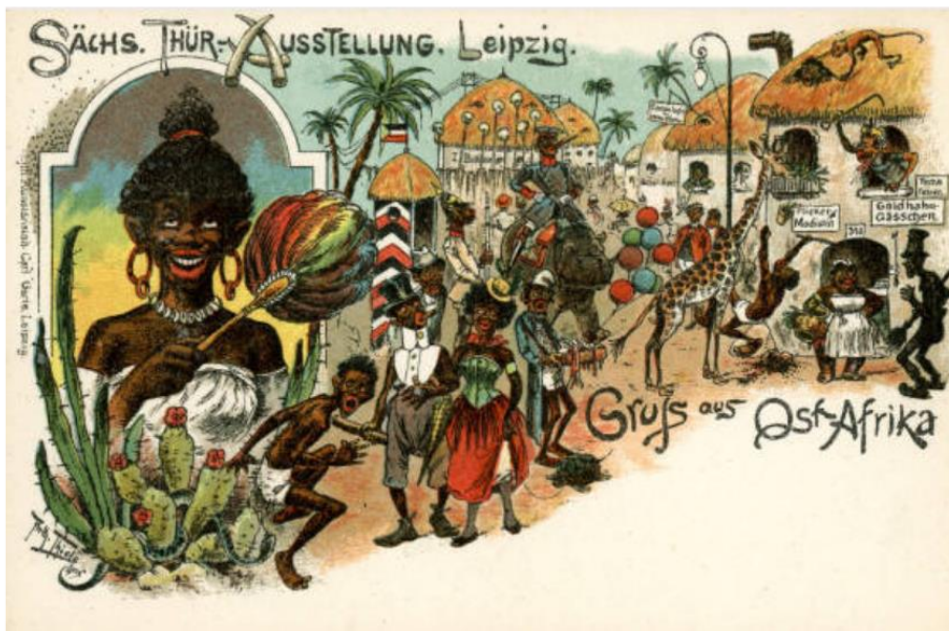
M2: Autor/In unbekannt. Gruss aus Ostafrika – Leipzig 1897, 1908.