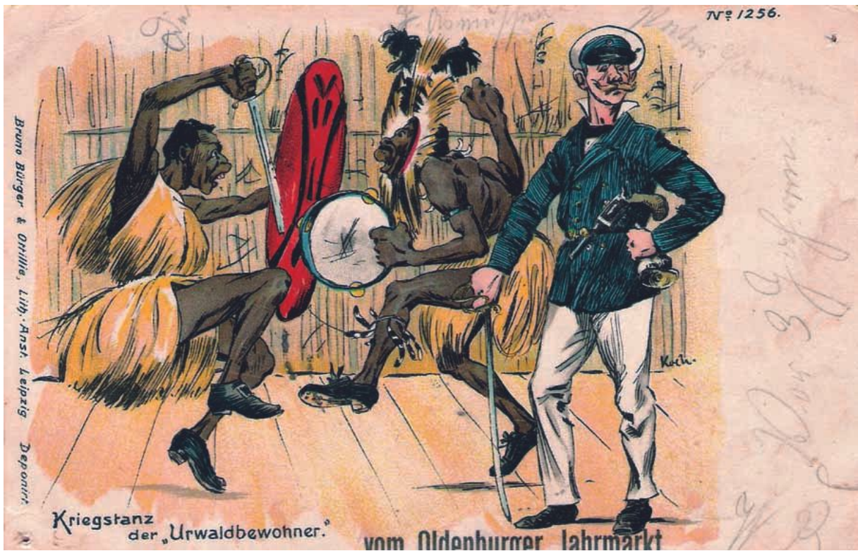
Kriegstanz der Urwaldbewohner, A. Koch, Mimosa, Leipzig 1898.