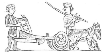
Bauern und Pflug des XIII. Jahrhunderts. Aus den Miniaturen des Heidelberger Sachsenspiegels.

Der Scharpflug ist die wichtigste Errungenschaft des Mittelalters. Der Pflug hatte nun zwei Räder und bestand zum Teil aus Eisen. Somit löste er den Hakenpflug der Römer ab.