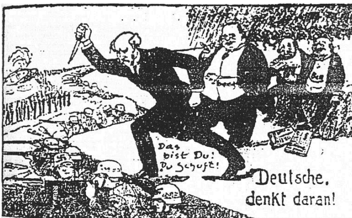
Titel: political cartoon 1924