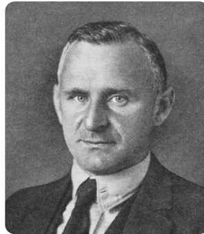
Q1: Carl Friedrich Goerdeler