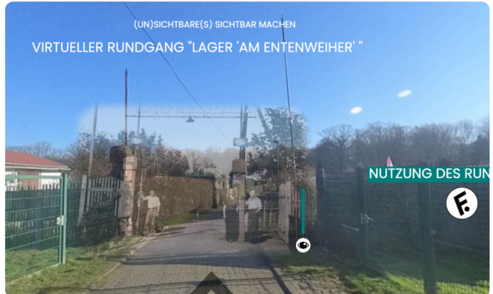
D1: Startseite virtueller Rundgang https://t1p.de/mk5y

③ Wähle gemeinsam mit einem Lernpartner ein Thema aus, das du im Anschluss an den Rundgang näher untersuchen möchtest. Notiert eine Begründung für eure Entscheidung.