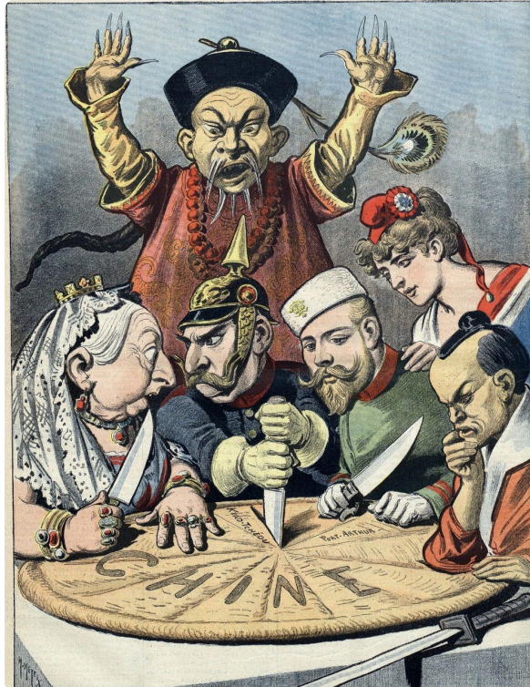
Abb. 1 — Der Kuchen der Könige und der Kaiser | französische Karikatur von 1898 | erschienen in „Le Petit Journal“ (eine Pariser Tageszeitung) am 16. Januar 1898