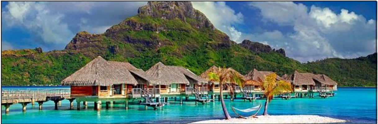
M0 Bora-Bora (Gesellschaftsinseln/Franz. Polynesien)

Bora-Bora ist eine der 14 Gesellschaftsinseln, die wiederum zu Französisch-Polynesien gehören. Insgesamt besteht Franz.-Polynesien aus 118 Inseln mit insgesamt etwa 283.000 Einwohnern. Etwa 11.000 Einheimische leben auf Bora-Bora, die meisten auf Tahiti (ca. 190.000 Ew.)