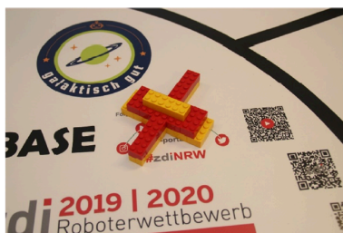
Gelb-roter Satellit zu Beginn in der Base

Der gelb-rote Satellit liegt zu Beginn in der Base. Der grün-blaue Satellit ist von der Umlaufbahn abgekommen und liegt am Anfang auf der grauen Markierung im Weltall.