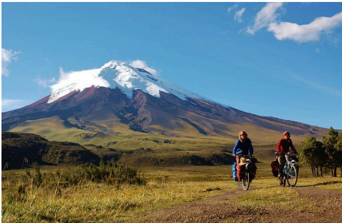
Cotopaxi