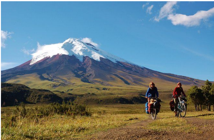
Cotopaxi