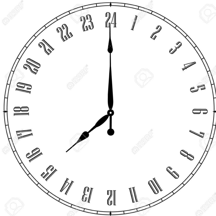
M4: Olivers Tagesablauf