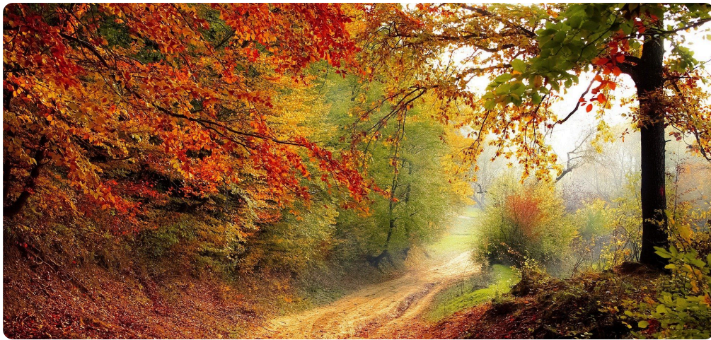
Der Herbst. Die Natur färbt sich rot, gelb, orange, braun.