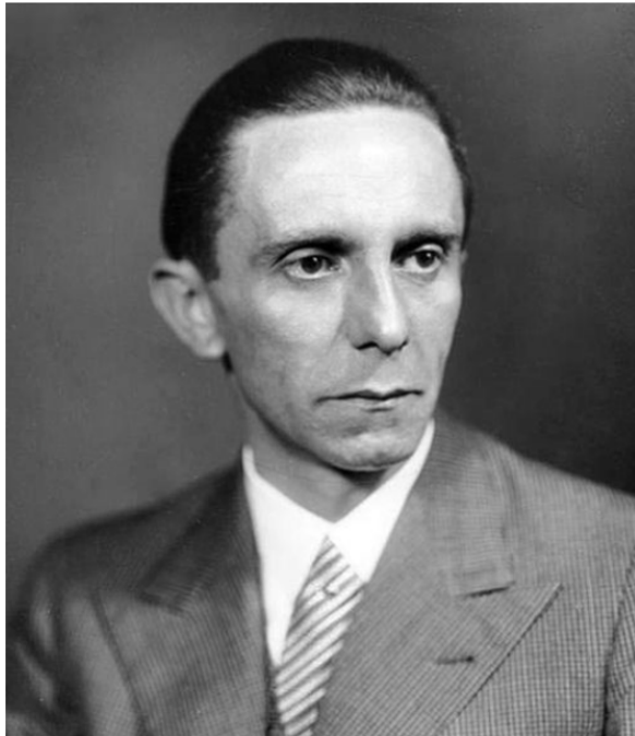
Joseph Goebbels- Propagandaminister