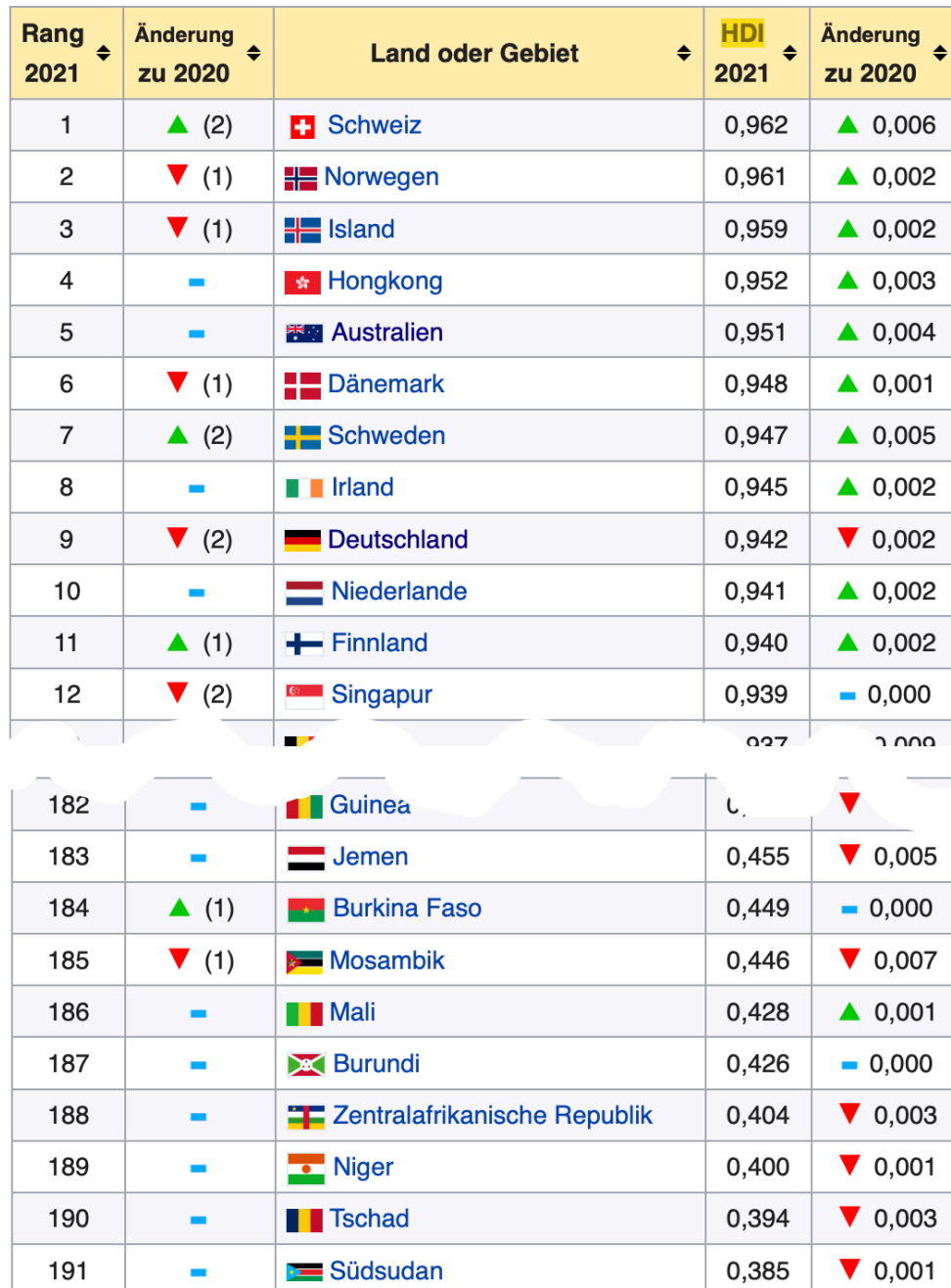
HDI Rangliste im Jahr 2021

② Informiere dich über andere Indizes, mit denen man Staaten vergleichen kann, z.B.: