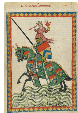
Ritter Ulrich von Lichtenstein