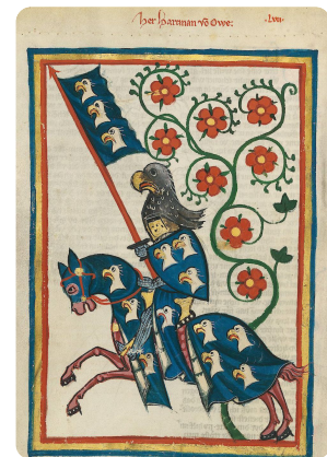
Ritter Hartmann von Aue