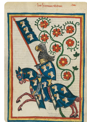
Ritter Hartmann von Aue