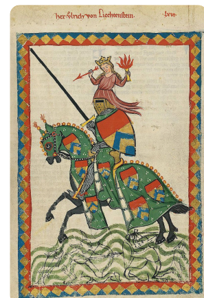
Ritter Ulrich von Lichtenstein