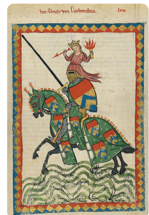
Ritter Ulrich von Lichtenstein