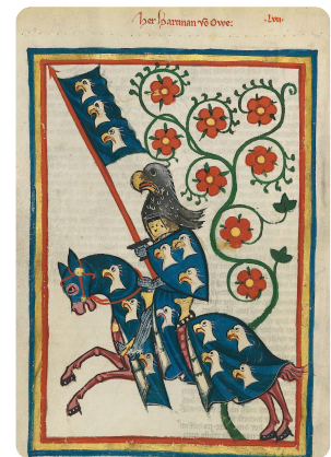
Ritter Hartmann von Aue