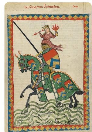
Ritter Ulrich von Lichtenstein