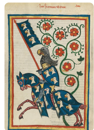
Ritter Hartmann von Aue