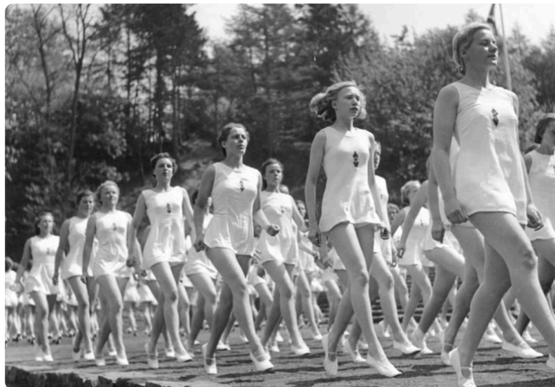
M1: „Bund Deutscher Mädel“ Gymnastikvorführung