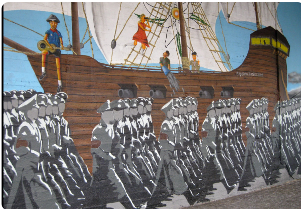
M2: Köln-Ehrenfeld: murals in honor of the „Edelweißpiraten“

2 + 90 Minuten (Inhalts- vermittlung und Leistungsüberp rügung)