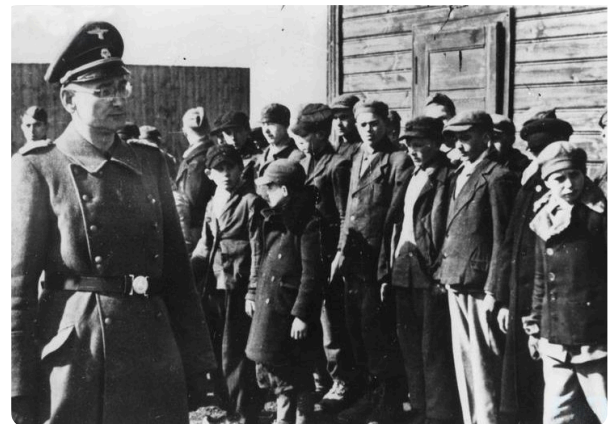
M3: Appell im Jugendverwahrlager Litzmannstadt, CC0, https://t1p.de/l25b