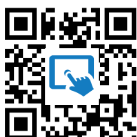
M1: Virtuelles Kartenforum https://t1p.de/kc1j