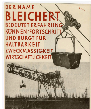
Q3: Werbeschrift der Firma Bleichert