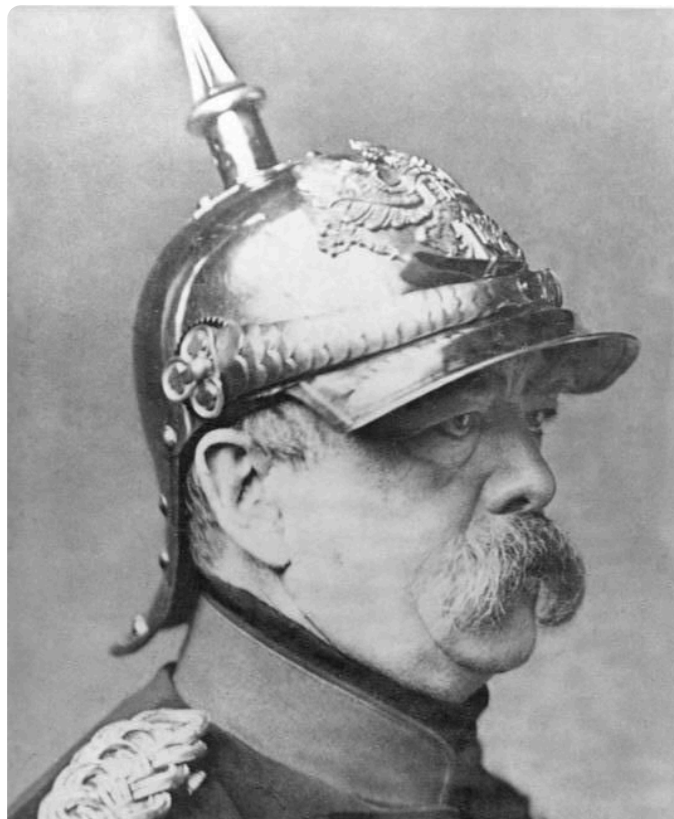
M1: Otto von Bismarck 1871, Bundesarchiv, Bild 183-R68588, P. Loescher & Petsch, CC-BY-SA 3.0, https://t1p.de/bc78