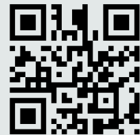
M4: Material „Manifest Destiny“ https://t1p.de/3fne

Im Lehrplan für Sachsen-Anhalt ist für die 11. und 12. Klassenstufe vorgesehen, dass die Schüler*innen „selbstständig Quellen aller Gattungen gattungsrecht interpretieren“ . (ebd. S. 5) Speziell für den Kompetenzbereich soll die Schüler*innen „die Entwicklungsprozesse in den USA untersuchen und die Herausbildung der amerikanischen Industrienation darstellen“ können. Diesen Anspruch erfüllt das Material, indem die Schüler*innen eine historische Karte interpretieren und die Verlagerungstendenzen der „Manufacturing Belts“ zum „Rust Belt“ erschließen und in eine „stumme Karte“ übertragen.