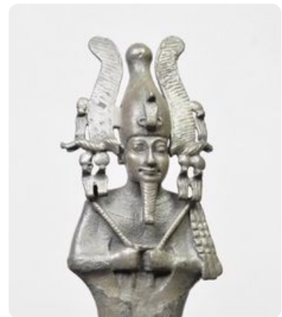
M1: Statuette Osiris, stehend mit Atef-Krone, Ägyptisches Museum, Staatliche Kunstsammlungen Berlin, CC-BY-NC-SA, https://t1p.de/4f0i

Doch es gibt Hoffnung : The British Museum und das Ägyptische Museum zu Berlin haben umfangreiche Online-Datenbanken erstellt, in denen Exponate selbstständig erkundet werden können. Holen Sie mit dieser Möglichkeit die Objekte und deren Atmosphäre in Ihr Klassenzimmer.