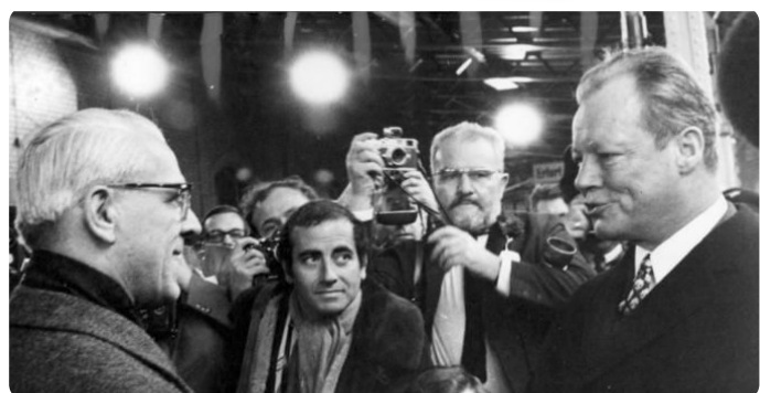
Q2: Annäherung der Regierungschefs, Willi Stoph (links) und Willy Brandt (rechts) in Erfurt 1970