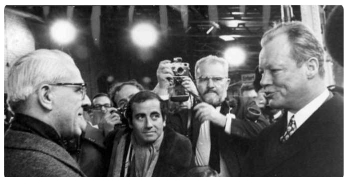
Q2: Annäherung der Regierungschefs, Willi Stoph (links) und Willy Brandt (rechts) in Erfurt 1970