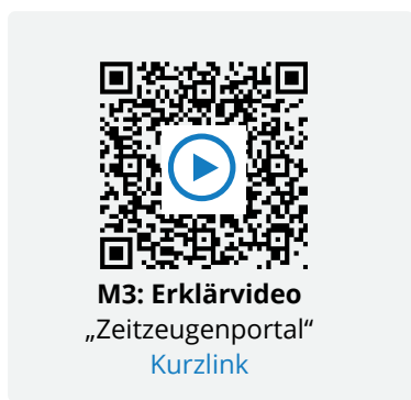
M3: Erklärvideo „Zeitzeugenportal“ Kurzlink