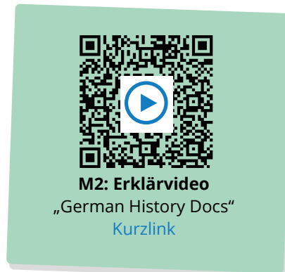
M2: Erklärvideo „German History Docs“ Kurzlink