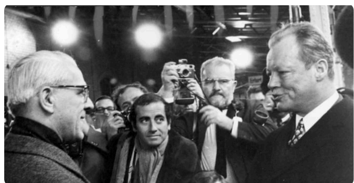
Q2: Annäherung der Regierungschefs, Willi Stoph (links) und Willy Brandt (rechts) in Erfurt 1970