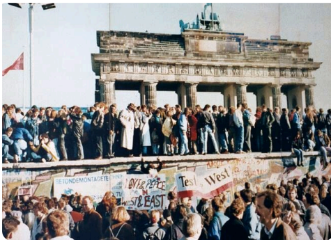
Q1: Menschen bejubeln Fall der Berliner Mauer 1989

Als Leistungsüberprüfung wird die Konzeption und der Vortrag einer Rede anlässlich einer Feier zur 30-jährigen Wiedervereinigung" vorgeschlagen, in der die Schüler*innen die deutsche Wiedervereinigung und ihre Nachwirkungen aus heutiger Sicht beurteilen sollen. Die Sonstige Leistung knüpft direkt an eine Aufgabenstellung des Lernmaterials an, in welcher die Schüler*innen ein Denkmal anlässlich einer Feier zur 30-jährigen Wiedervereinigung entwerfen sollen.