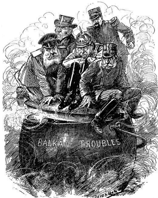
THE BOILING POINT.

Q1: Edwardian Era, Europe WW1 Cartoons Raven Hill Q2: Gabriele Galantara in: Der wahre Jakob, 1913 Punch Magazine, 1912