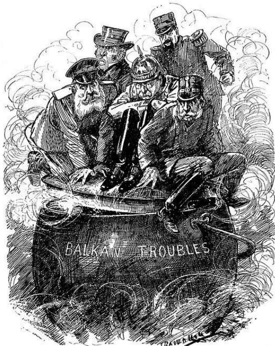
THE BOILING POINT.

Q1: Edwardian Era, Europe WW1 Cartoons Raven Hill Q2: Gabriele Galantara in: Der wahre Jakob, 1913 Punch Magazine, 1912