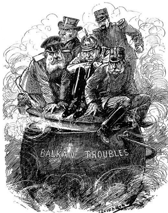
THE BOILING POINT.

Q1: Edwardian Era, Europe WW1 Cartoons Raven Hill Punch Magazine, 1912