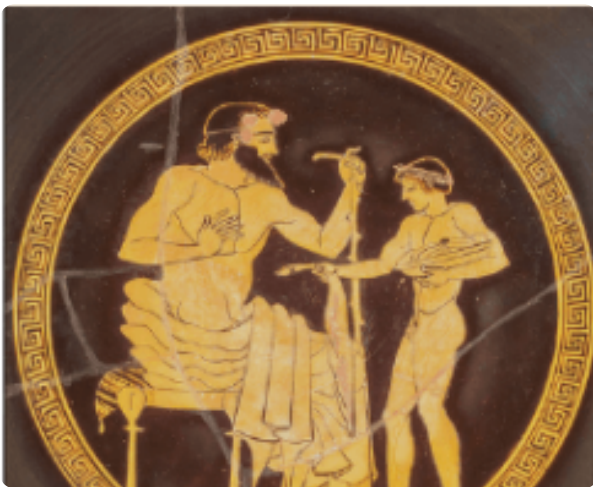
Bürger und Sklave/Diener Darstellung auf einer Trinkschale aus Kreamik, 5. Jahrhundert v. Chr. in: Sauer, Michael (Hrsg.): Geschichte und Geschehen 5 (Sachsen Gymnasium ab 2020), Stuttgart 2020 S.90.

Die SuS sollen durch die 90-minütige Einheit einen Einblick in das Zusammenleben im antiken Griechenland erhalten. Die Stunde ist für die Klassenstufe 5 am Gymnasium konzipiert worden. Im Vordergrund der Stunde sollen die alltäglichen Gewohnheiten der Griechen stehen. Hierbei soll insbesondere das Leben als Hausherr betrachtet werden. Dazu sollen Darstellungstexte und Textquellen im Lehrbuch dienen. Außerdem wird die Ehe und die Aufgaben der Frau im Haushalt durch Textquellen thematisiert. Indes behandeln die SuS eine Bildquelle, auf der eine Schale zu Bürger und Dienern dargestellt ist. Außerdem sollen die Lehrmittel der Griechen gezeigt werden, indem der Unterricht thematisiert wird. Die SuS suchen dabei aus der digitalen Sammlung der deutschen digitalen Bibliothek eine Schale heraus, auf der der antike Unterricht gezeigt wird. Den Abschluss der Stunde bildet ein Vergleich, in dem die SuS die Gemeinsamkeiten und Unterschiede im alltäglichen Leben darstellen sollen. Die Leistungsüberprüfung erfolgt durch einen Tagebucheintrag als sonstige Leistung.