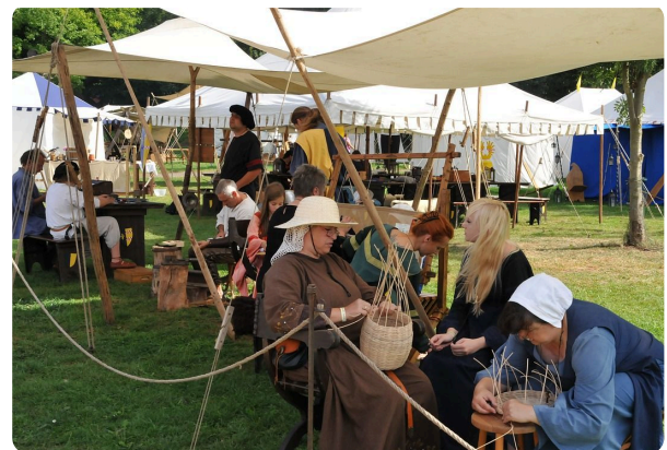
M2 Stand eines Korbmachers auf einem heutigen Mittelaltermarkt, CC0