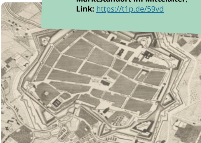
M5 historischer Kupferstich der Stadt Leipzig im Mittelalter um 1740

Erklärvideo: Nutzung des Münzkabinetts Kenom Link: https://t1p.de/8zrn