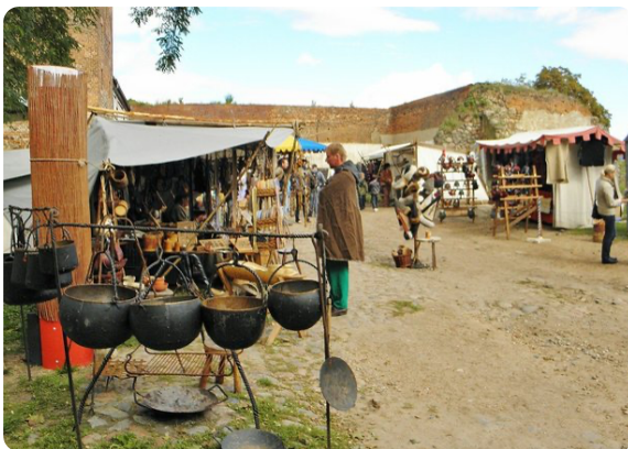
M1 Stand eines Topfmachers auf einem heutigen Mittelaltermarkt, CC0