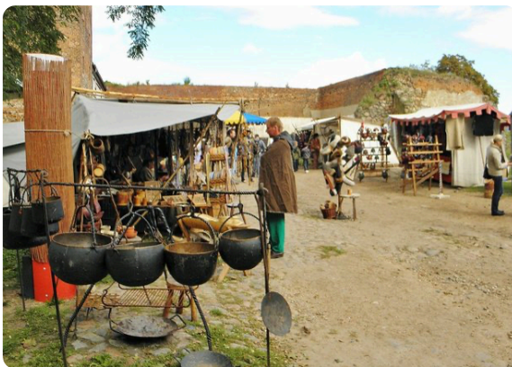
M1 Stand eines Topfmachers auf einem heutigen Mittelaltermarkt, CC0