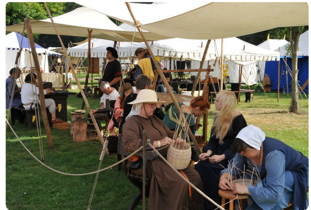
M2 Stand eines Korbmachers auf einem heutigen Mittelaltermarkt, CC0