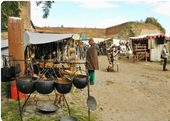
M1 Stand eines Topfmachers auf einem heutigen Mittelaltermarkt, CC0