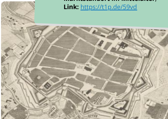
M5 historischer Kupferstich der Stadt Leipzig im Mittelalter um 1740

Erklärvideo: Nutzung des Münzkabinetts Kenom Link: https://t1p.de/8zrn