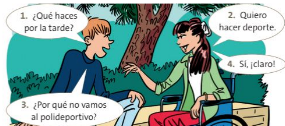
Hacer propuestas Y reaccionar

Beispiellösung Mario: Lo siento, no puedo entrenar para el partido de pádel. Tengo que empollar para el examen de Mates. Victoria y Blanca: ¡Qué val! No podemos ver la peli. Tenemos que hacer los deberes ahora. Rafa y su prima Elena: Lo siento. No puedo hablar por skype hoy. Tengo que ir a la cama pronto. ● Algo más Lernstarke S, die die Aufgabe 11 schnell beenden, können im Anschluss die Algo más Übung auf S. 145 bearbeiten (Lösung s. HRU S. 184).