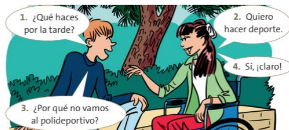
Hacer propuestas Y reaccionar

Beispiellösung Mario: Lo siento, no puedo entrenar para el partido de pádel. Tengo que empollar para el examen de Mates. Victoria y Blanca: ¡Qué val! No podemos ver la peli. Tenemos que hacer los deberes ahora. Rafa y su prima Elena: Lo siento. No puedo hablar por skype hoy. Tengo que ir a la cama pronto. ● Algo más Lernstarke S, die die Aufgabe 11 schnell beenden, können im Anschluss die Algo más Übung auf S. 145 bearbeiten (Lösung s. HRU S. 184).