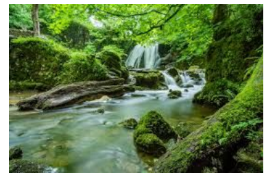
Beispiele für Leistungen des Waldes