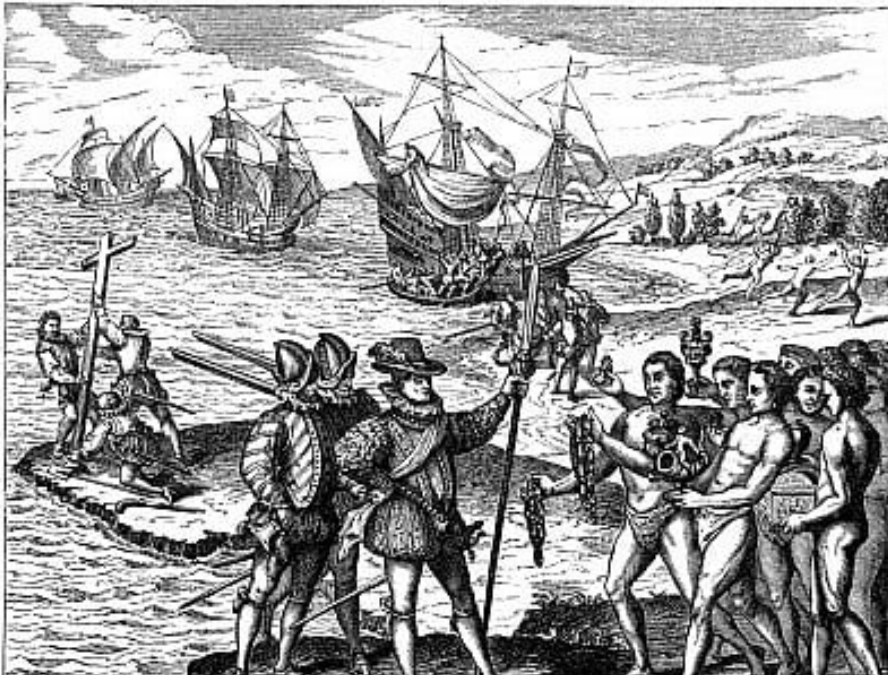
Kolumbus Ankunft in der „Neuen Welt“ Kupferstich von 1594

Die Eingeborenen, glaube ich, sehen mich für einen Gott und die Schiffe für Ungeheuer an. Ich überwand ihre Scheu, indem ich Halsketten und rote Kappen an sie verteilen ließ. Bald wagten sie es, heranzukommen und uns vorsichtig zu berühren. (...) Sie gehen umher, wie Gott sie geschaffen hat. (...) Ihre Haut ist von rötlich-gelber Farbe, ihr Haar tiefschwarz und glatt. (...) Sie sind ohne Zweifel gutmütig und sanft. Ihre einzigen Waffen sind Lanzen mit einer Spitze aus Stein oder dem Knochen eines Fisches, (...) Ich glaube, man könnte sie leicht zum Christentum bekehren. (...) Auf der Heimfahrt werde ich sehr dieser Männer mitnehmen, um sie dem König und der Königin zu zeigen. (...) Sie sind gewiss gute Diener. Sie haben einen aufgeweckten Verstand, denn ich sehe, dass sie sehr schnell nachsagen können, was man ihnen vorspricht.