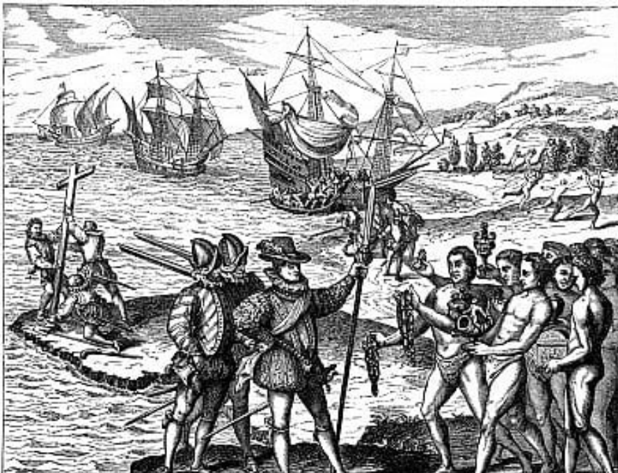
Kolumbus Ankunft in der „Neuen Welt“ Kupferstich von 1594

Die Eingeborenen, glaube ich, sehen mich für einen Gott und die Schiffe für Ungeheuer an. Ich überwand ihre Scheu, indem ich Halsketten und rote Kappen an sie verteilen ließ. Bald wagten sie es, heranzukommen und uns vorsichtig zu berühren. (...) Sie gehen umher, wie Gott sie geschaffen hat. (...) Ihre Haut ist von rötlich-gelber Farbe, ihr Haar tiefschwarz und glatt. (...) Sie sind ohne Zweifel gutmütig und sanft. Ihre einzigen Waffen sind Lanzen mit einer Spitze aus Stein oder dem Knochen eines Fisches, (...) Ich glaube, man könnte sie leicht zum Christentum bekehren. (...) Auf der Heimfahrt werde ich sehr dieser Männer mitnehmen, um sie dem König und der Königin zu zeigen. (...) Sie sind gewiss gute Diener. Sie haben einen aufgeweckten Verstand, denn ich sehe, dass sie sehr schnell nachsagen können, was man ihnen vorspricht.