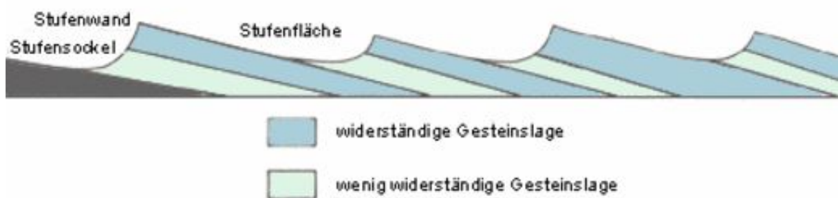
Profil einer Schichtstufenlandschaft

Eine Schichtstufenlandschaft entsteht, wenn Schichtpakete morphologisch harter und weicher Gesteine flach geneigt sind und ungleich abgetragen werden. Morphologisch hart sind die wasserdurchlässigen Gesteine wie Kalk und Sandstein. Sie bilden Steilstufen. Morphologisch weich sind die wasserundurchlässigen Gesteine wie Sandsteine mit tonigem Bindemittel, Mergel und Schiefer. Sie bilden die sanfteren Böschungen unterhalb der Steilstufe und die Stufenflächen, die zur nächsten Stufe überleiten. Die harte Schicht wird langsamer abgetragen als die darunter liegende weiche, die schneller verwittert. Dadurch wird die harte Schicht unterhöhlt und bricht nach. Es entsteht eine Kante, die immer weiter zurückwandert (rückschreitende Erosion). Wenn dadurch die nächste harte Schicht freigelegt wurde ereignet sich dort mit der wiederum darunterliegenden weicheren Schicht das gleiche. Die nächste Stufe entsteht.