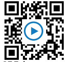
Q7 Zeitzeugeninterview https://t1p.de/zv8g

„Das ist ja das, was man natürlich 1939 gar nicht ahnte.“