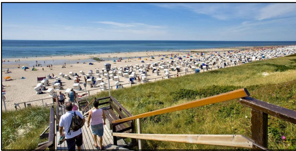
M2: Blick auf den Strand

Insgesamt bietet Sylt eine ausgewogene Mischung aus Erholung, Naturerlebnissen und Aktivitäten für verschiedene Interessen. Unabhängig davon, ob man die Strände, die Natur oder Abenteuer genießen möchte, hält die Insel für jeden Geschmack etwas bereit.