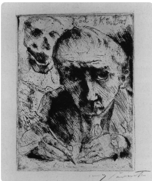
Lovis Corinth, Totentanz - Tod und Künstler, 1922