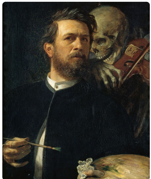
Arnold Böcklin, Selbstbildnis mit fiedelndem Tod, 1872