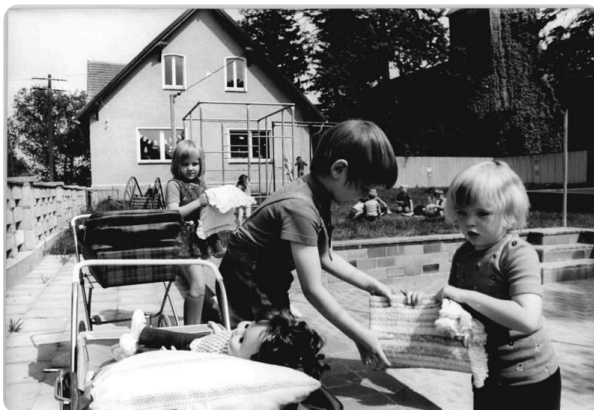
Kinder Spielen gemeinsam

① Lies den Text über Freundschaft. Was ist Freundschaft?