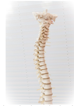
wirbelsäule, bandscheibe, rücken

Die bestehen aus Knochen und sind je nach Abschnitt der unterschiedlich groß. Die kleinsten findet man in der , die größten in der .