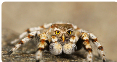
Speule (ein Bild von Pixabay)